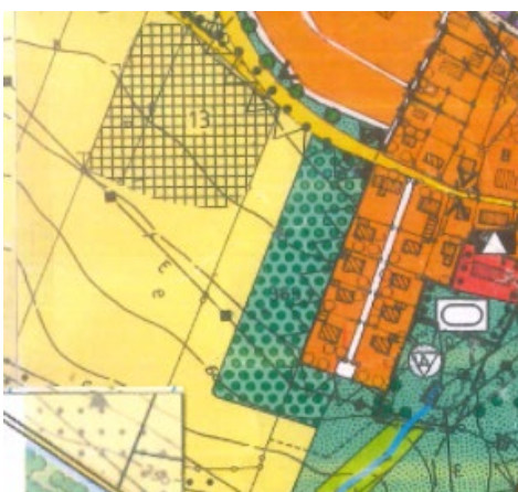
Abbildung 1: Ausschnitt aus dem rechtskräftigen Flächennutzungsplan der Marktgemeinde Hengersberg

Der Flächennutzungsplan stellt den geplanten Modulbereich als Fläche für die Landwirtschaft dar. Der Flächennutzungsplan wird im Parallelverfahren durch Deckblatt Nr. 42 geändert.