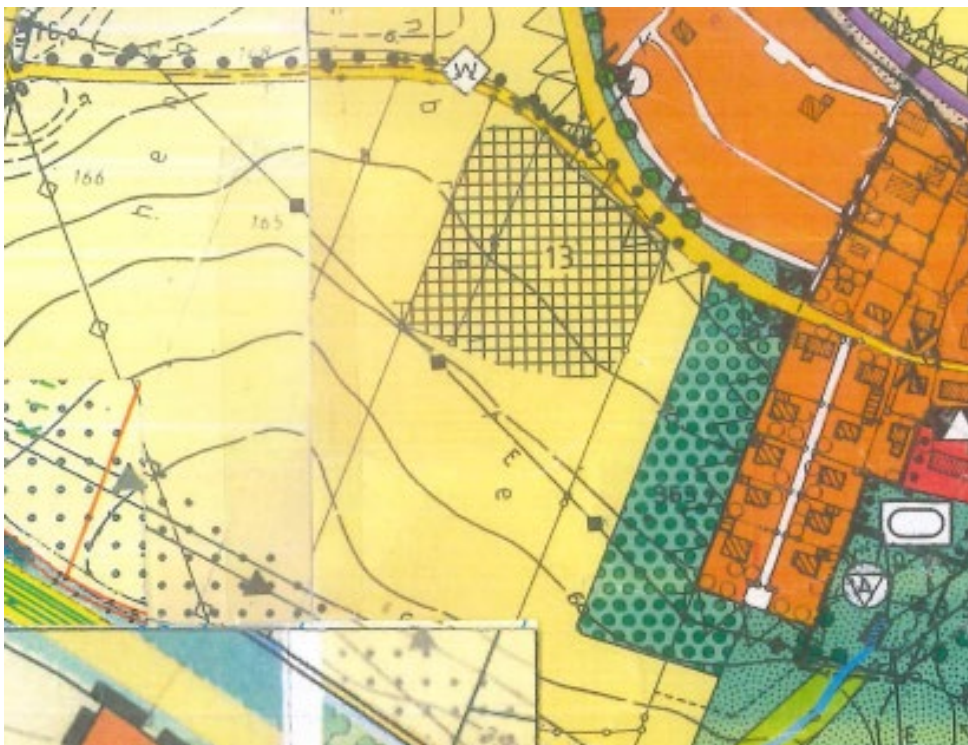
Abbildung 1: Ausschnitt aus dem rechtskräftigen Flächennutzungsplan der Marktgemeinde Hengersberg

Der Flächennutzungsplan stellt den geplanten Modulbereich als Fläche für die Landwirtschaft dar. Der Flächennutzungsplan wird im Parallelverfahren durch Deckblatt Nr. 42 geändert.